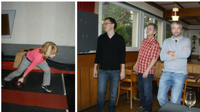
Die Dame zeigte den staunenden Herren wo's lang geht!

Am Freitag, 03.05.2013 , haben wir unser Sommerprogramm im Restaurant Höfli in Otelfingen eingeegelt. An diesem hochdotierten Event fehlte einer – der Sommer. Wie sich später herausstellte, mussten wir in diesem Jahr sehr lange auf ihn warten. Nichts desto trotz haben wir hart und fair um den Sieg gekegelt.